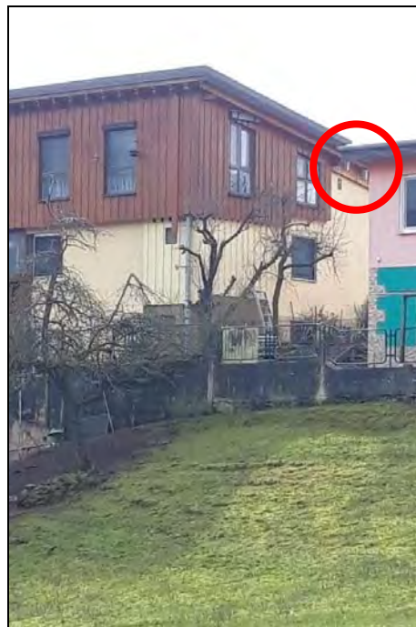
Abb. 9: Brutplätze des Haussperlings am Gebäudebestand südlich des Untersuchungsgebietes