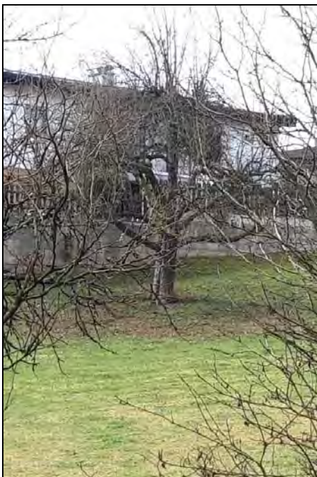
Abb. 8: Älterer Apfelbaum