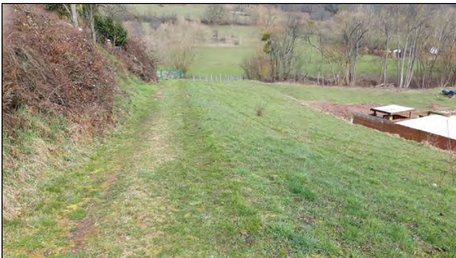
Abb. 6: Flst. Nr. 2148 im östlichen Untersuchungsgebiet und Grasweg