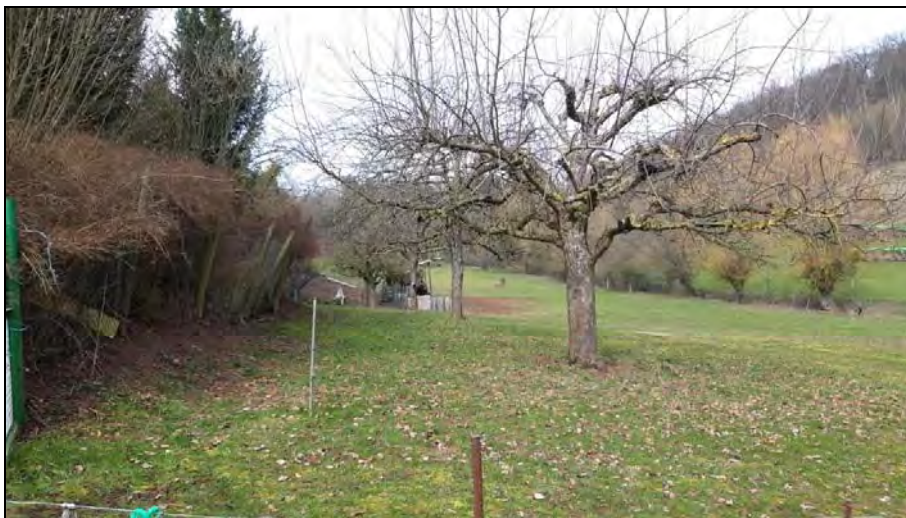
Abb. 3: Obstbäume und Wiese