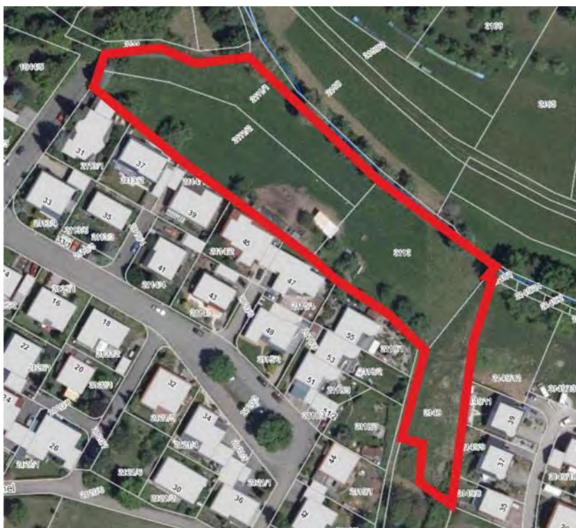
Abb. 1: Luftbild mit Abgrenzung Untersuchungsgebiet (LUBW, 2021)

Die LRT-Typen 6430 - Feuchte Hochstaudenfluren, 6510 - Magere Flachland-Mähwiesen, 91EO* - Erlen-Eschen- und Weichholzaauenwälder liegen nördlich außerhalb des Geltungsbereichs des Bebauungsplanes.