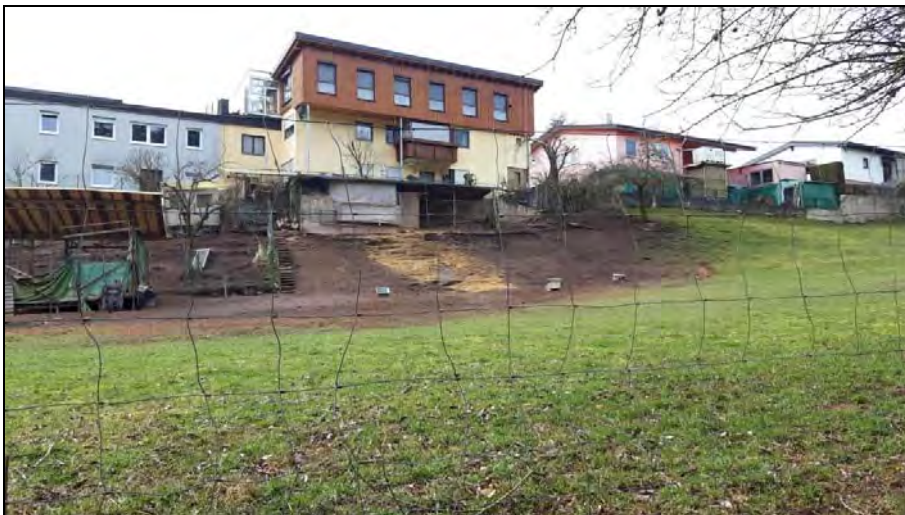
Abb. 5: Hühnerställe und Schuppen, dahinter Stützmauern und angrenzende Wohnbebauung