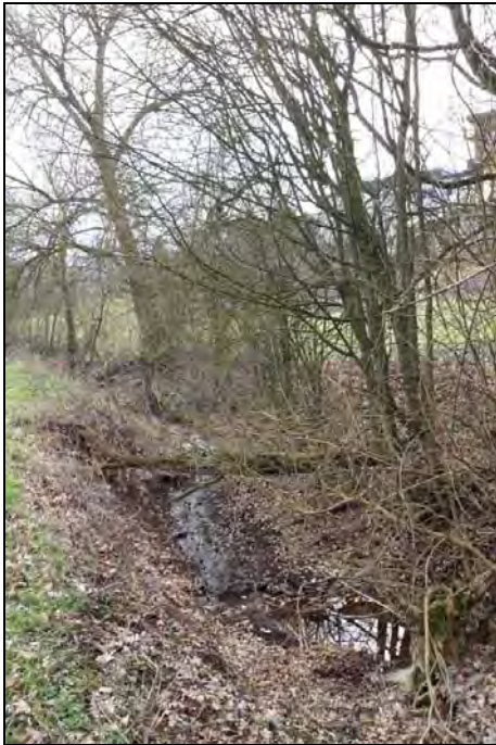
Abb. 10: Der Bachlauf der „Riesenklinge“ ist nicht dauerhaft wasserführend