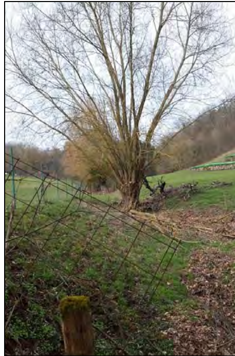
Abb. 11: Weide an der „Riesenklinge“, das Bachbett ist hier bereits ausgetrocknet