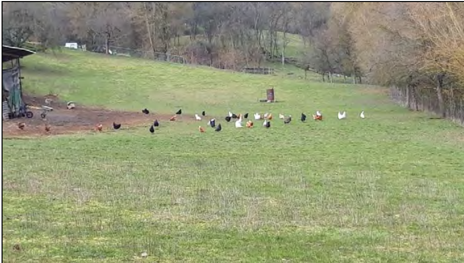
Abb. 7: Hühnerhaltung