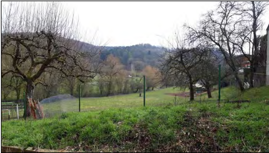
Abb. 4: Blick aus Westen in das Untersuchungsgebiet und die Gehölzbestände entlang der „Riesenklinge“