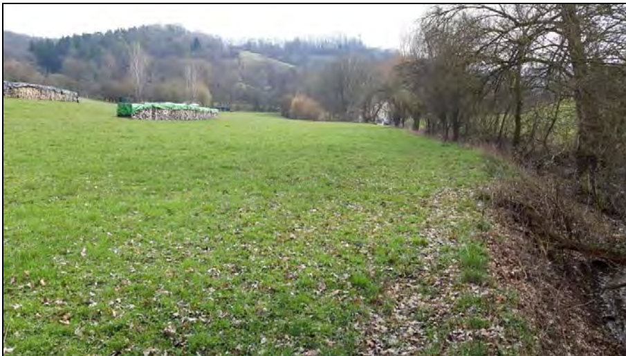
Abb. 12: Blick auf die nördlich der „Riesenklinge“ liegenden Mähwiesen im FFH-Gebiet gegenüber des Untersuchungsgebietes