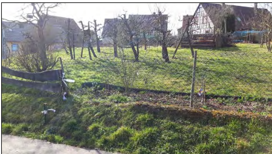
Abb. 7: Hausgarten mit überalterten Obstbaumkulturen