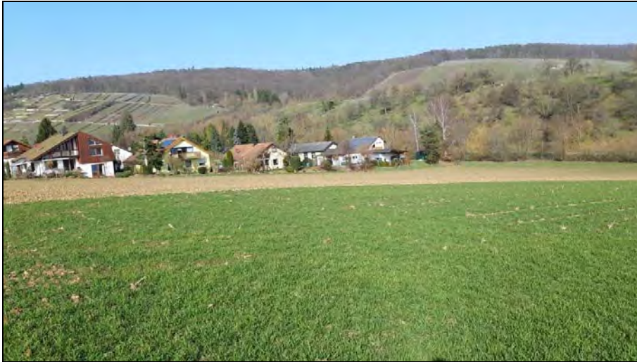
Abb. 4: Wohnbebauung nördlich am Untersuchungsgebiet, im Hintergrund die beeindruckenden Rebhänge mit Trockenmauern von Ochsenbach