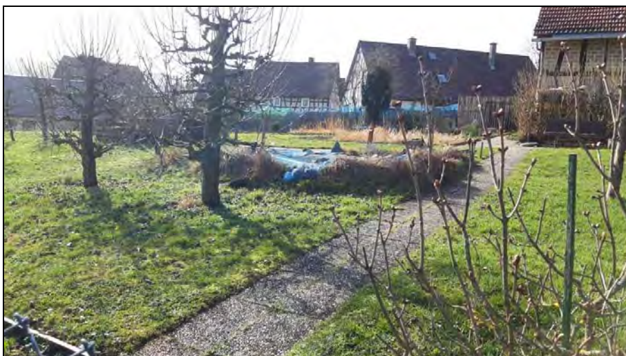
Abb. 8: Teich im Hausgarten aus vorstehender Abb. 7