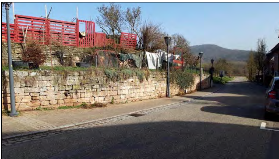
Abb. 10: Trockenmauern entlang der „Dorfstraße“