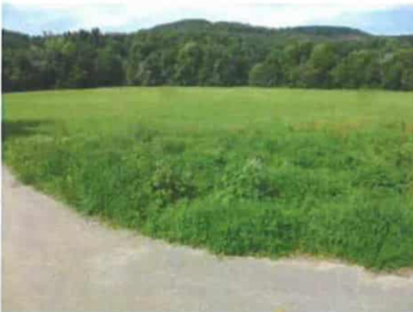
Abb. 5: Standortvariante 4 mit extensiv genutztem Grünland mit Großem Wiesenknopf