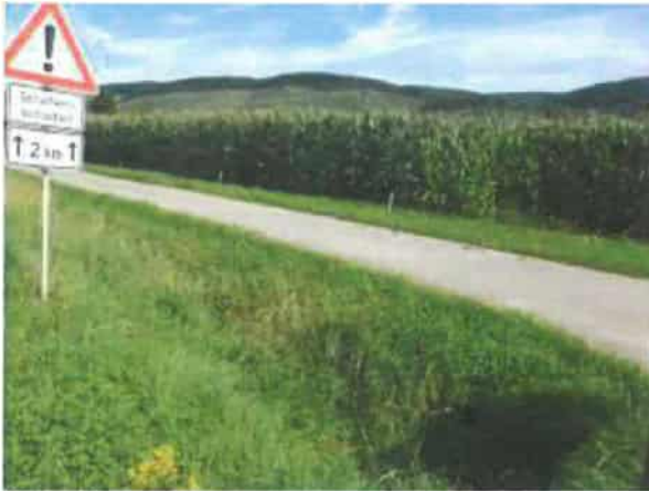
Abb. 3: Standortvariante 2 mit intensiver ackerbaulicher Nutzung (Mais) und Grünstreifen.