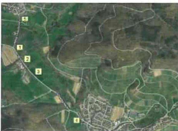
Abb. 1: Lage der fünf Standortvarianten zum Bau des Feuerwehrgebäudes im FFH-Gebiet.

Bei einer Begehung am 14.08.2017 wurden die fünf Standortvarianten hinsichtlich ihrer Habitataignung für europarechtlich geschützte Arten (Arten nach Anhang IV der FFH-Richtlinie, europäische Vogelarten) bewertet. Während die Standortvarianten 1-3 intensiv ackerbaulich genutzt werden (2017 wurde Mais angebaut), werden die Standortvarianten 4 und 5 von extensiv genutzten Grünland eingenommen, wobei wesentlich ist, dass in beiden Wiesen der Große Wiesenknopf ( Sanguisorba officinalis ) auftritt. Die nachfolgenden Abbildungen sollen die örtlichen Gegebenheiten veranschaulichen: