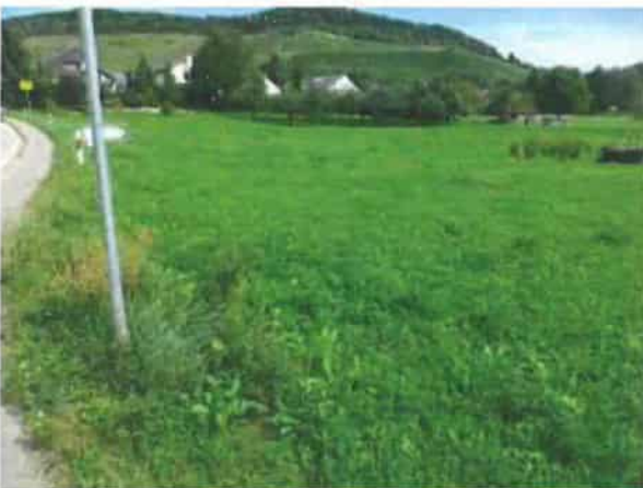
Abb. 7: Standortvariante 5 mit extensiv genutztem Grünland mit Großem Wiesenknopf