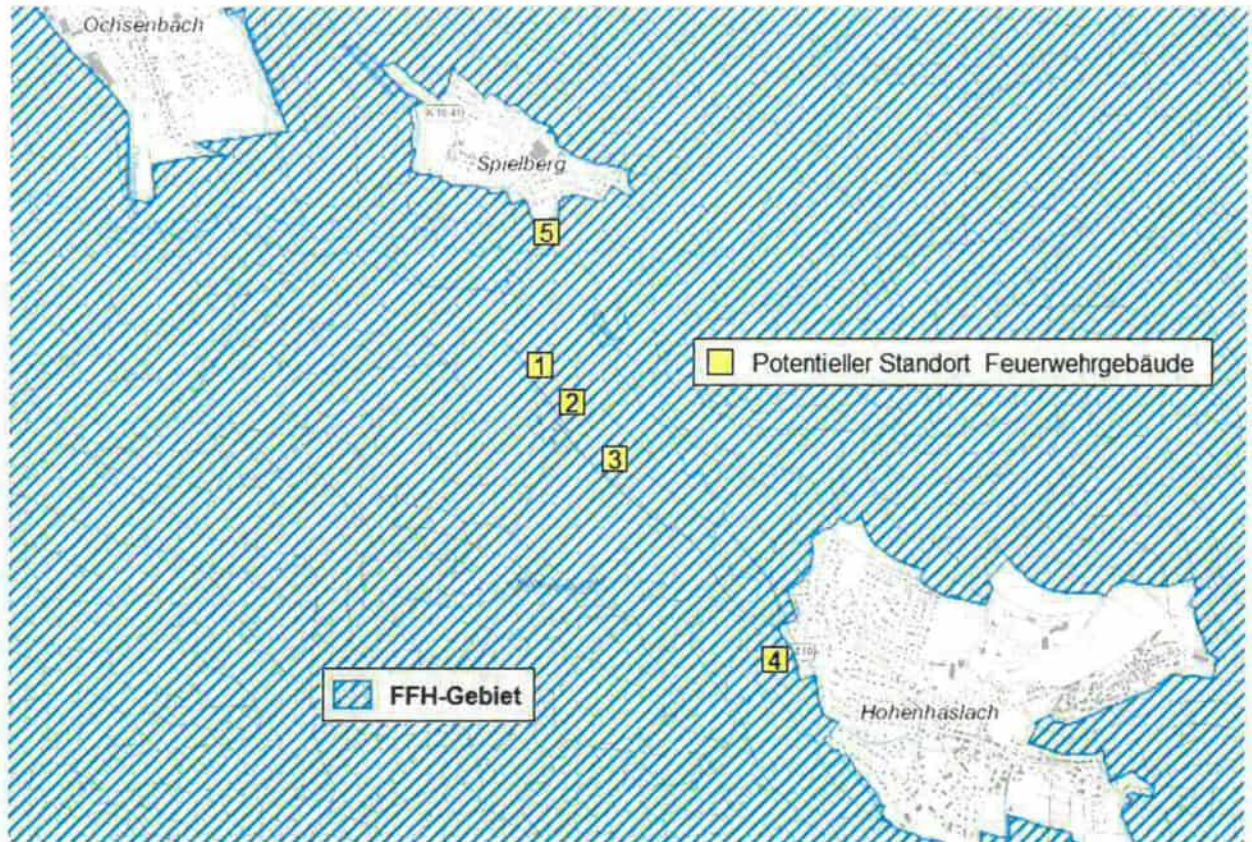
Abb. 9: Lage der Standortvarianten 1-5 im FFH-Gebiet