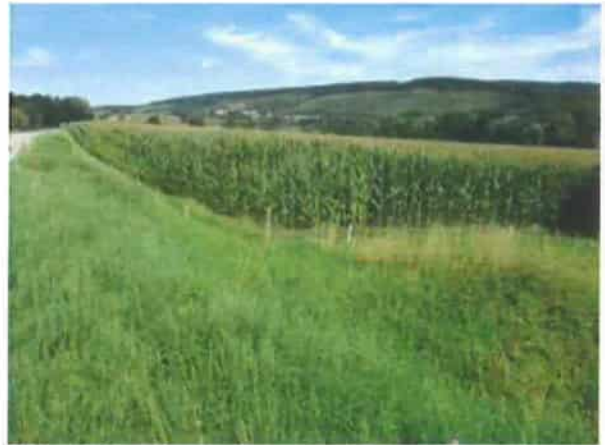
Abb. 4: Standortvariante 3 mit intensiver ackerbaulicher Nutzung (Mais) und Grünstreifen.