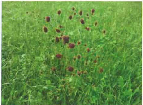
Abb. 6: Standortvariante 4 mit extensiv genutztem Grünland mit Großem Wiesenknopf