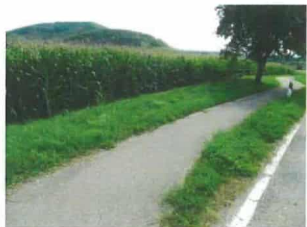
Abb. 2: Standortvariante 1 mit intensiver ackerbaulicher Nutzung (Mais) und Grünstreifen.