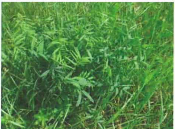
Abb. 8: Standortvariante 5 mit extensiv genutztem Grünland mit Großem Wiesenknopf

Alle Standortvarianten befinden sich innerhalb der Zone des FFH-Gebiets Nr. 7018341 („Stromberg“, vgl. Abb. 9) und sind daher der FFH-Vorprüfung zu unterziehen.