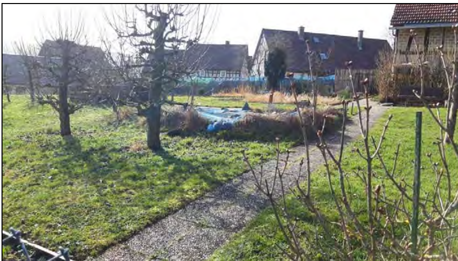
Abb. 8: Teich im Hausgarten aus vorstehender Abb. 7