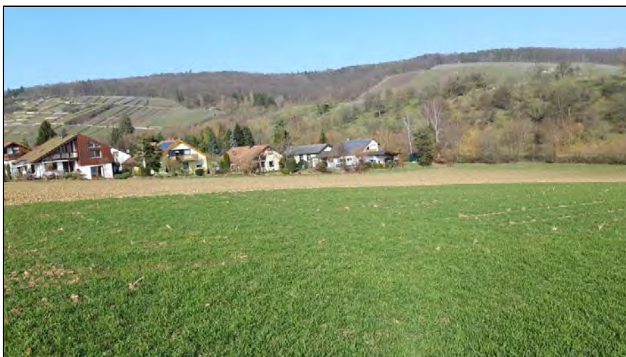
Abb. 4: Wohnbebauung nördlich am Untersuchungsgebiet, im Hintergrund die beeindruckenden Rebhänge mit Trockenmauern von Ochsenbach