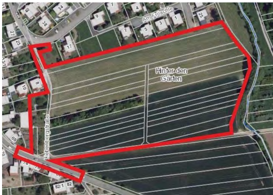
Abb. 1: Luftbild mit Abgrenzung Untersuchungsgebiet (LUBW, 2021)

Im östlichen Untersuchungsgebiet liegen mit geringen Anteilen Kernraum und Suchraum des Biotopverbunds mittleren Standorte sowie Suchraum des Biotopverbunds feuchte Standorte (LUBW 2021).