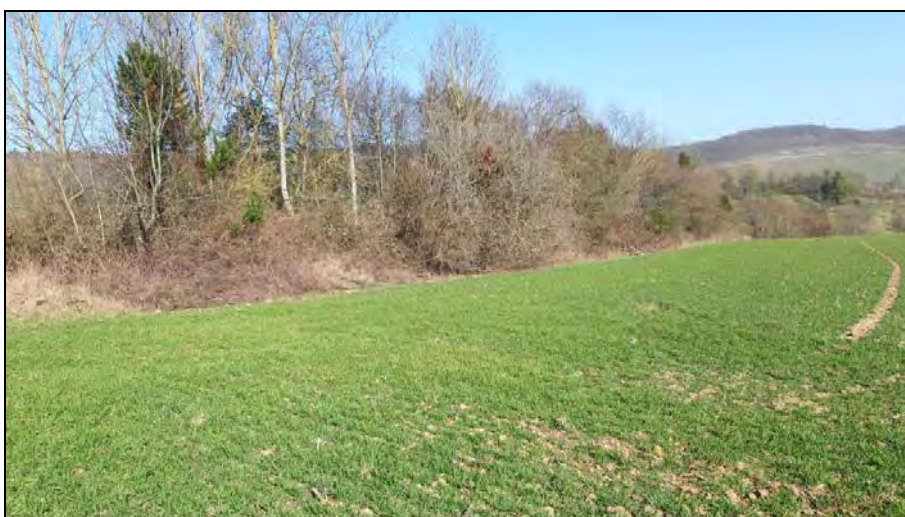
Abb. 5: Feldgehölz im Zentrum des Untersuchungsgebiets