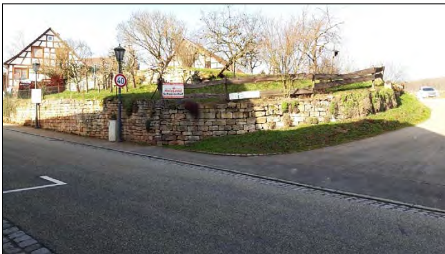
Abb. 11: Trockenmauer entlang der „Dorfstraße“ an der Einmündung zur „Liebenbergstraße“