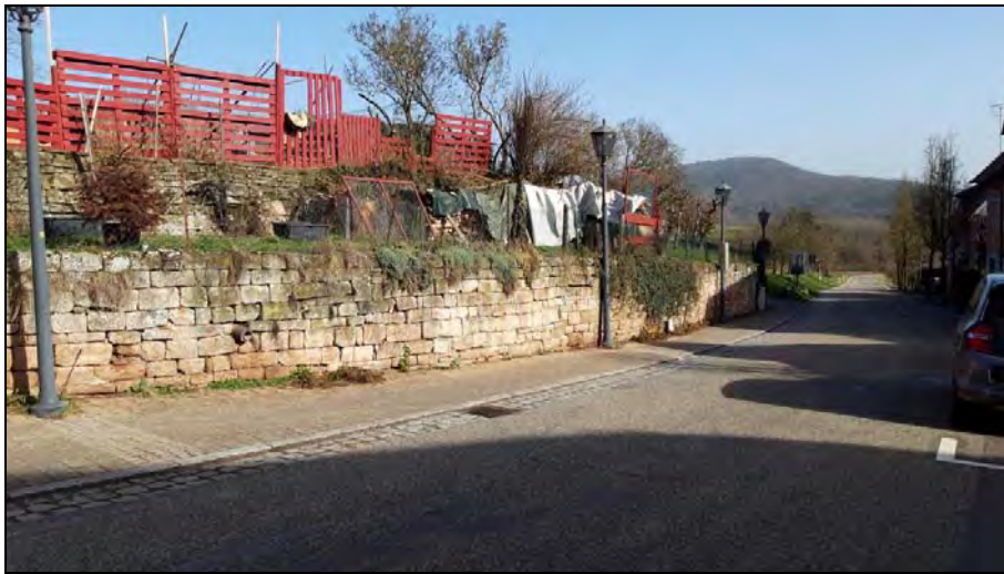
Abb. 10: Trockenmauern entlang der „Dorfstraße“