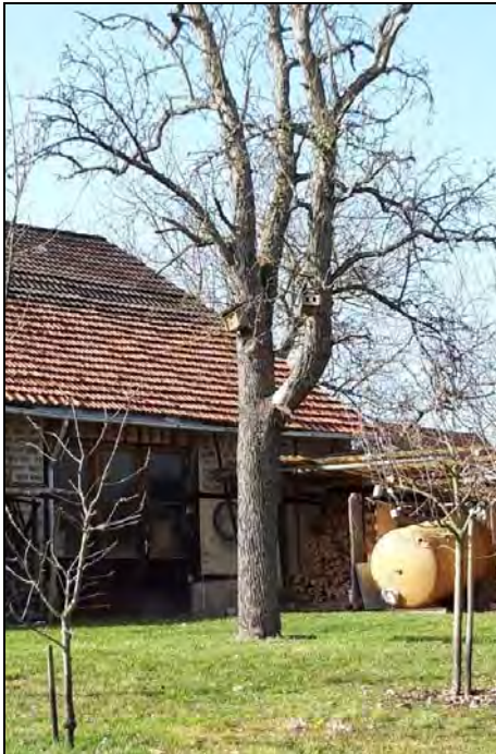
Abb. 13: Birnbaum mit Nistkästen