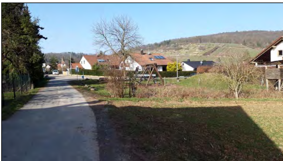
Abb. 12: Spielplatz an der „Liebenbergstraße“