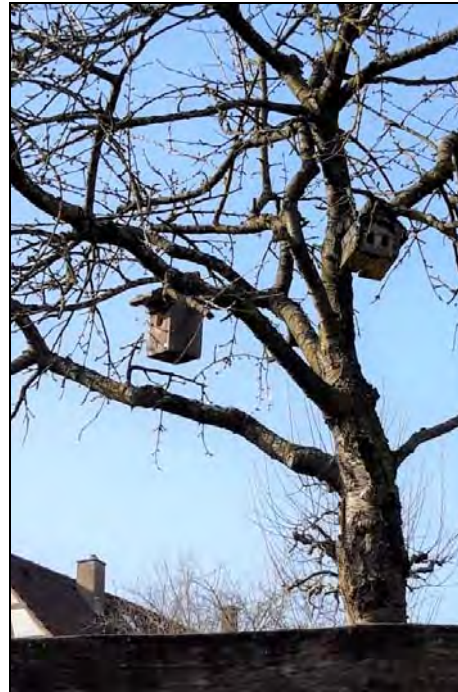
Abb. 14: Nistkästen an einem Kirschbaum