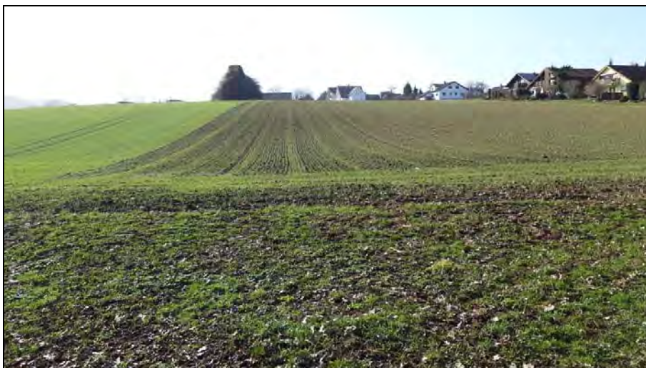
Abb. 3: Ansicht aus Osten auf das Untersuchungsgebiet