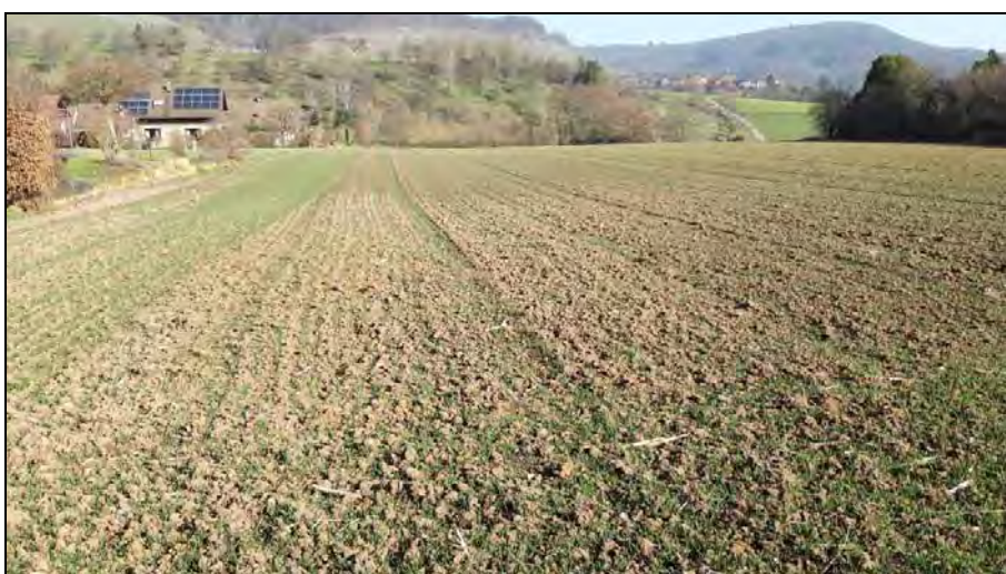
Abb. 6: Ackerflächen dominieren im Untersuchungsgebiet