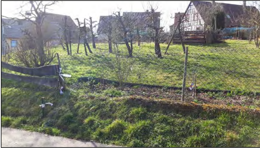
Abb. 7: Hausgarten mit überalterten Obstbaumkulturen