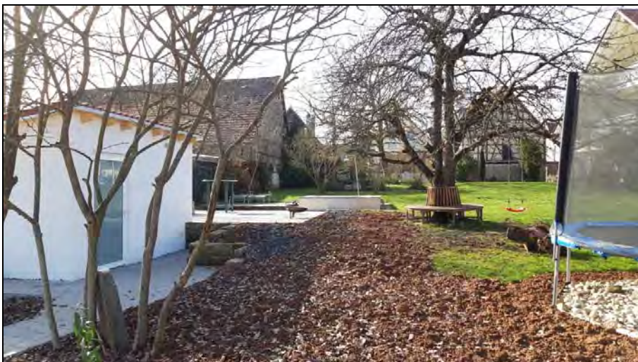
Abb. 9: Freizeitgarten an der „Liebenbergstraße“